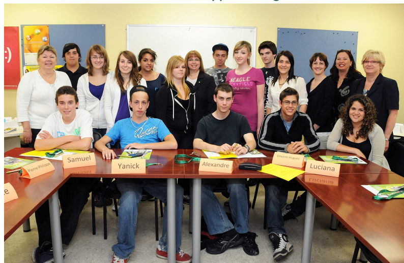
Les 15 jeunes en présence des représentantes de la Caisse Desjardins de Saint-Hubert et du Carrefour jeunesse-emploi Saint-Hubert.

Le CJESH a pour mission d'améliorer les conditions de vie des jeunes adultes, âgés entre 16 et 35 ans, du territoire de Saint-Hubert, par des services et des projets d'employabilité, d'orientation professionnelle et d'entrepreneuriat. L'approche est volontaire et vise l'autonomie et la prise en charge, par le jeune adulte, de sa vie personnelle, sociale et professionnelle.